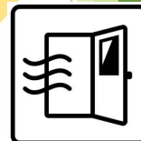
ドアオープン営業